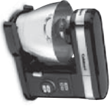
Stand Mixers Bateurs sur socle